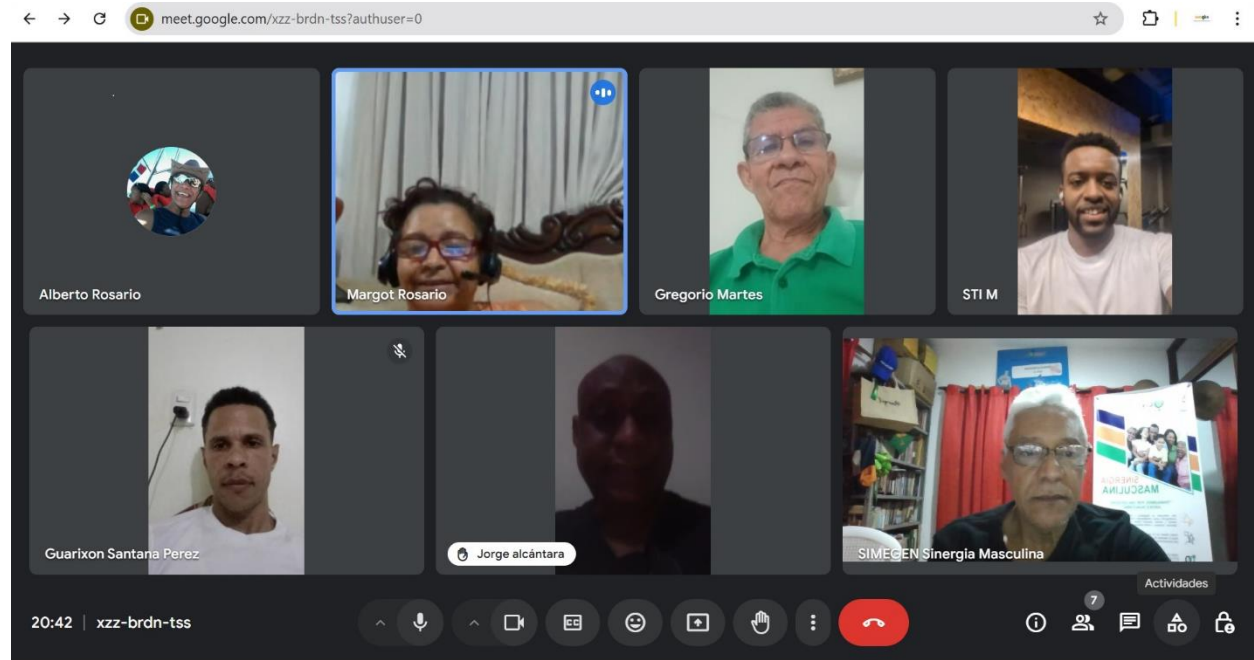
Reunión virtual SIMEGEN